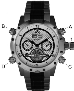
Conqueror Modell-Nr.: 140-H Automatikwerk Kaliber H-09.140 20 Steine