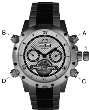
Conqueror Modelnr.: 140-H automatisch uurwerk Kaliber H-09.140 20 lagerstenen