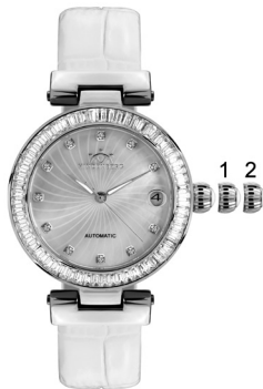
Grand Lady Model-No.: 360-H Automatic movement calibre H-10.360 20 jewels