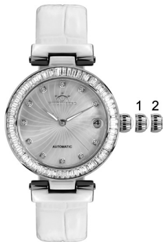
Grand Lady Modelnr.: 360-H automatisch uurwerk Kaliber H-10.360 20 lagerstenen