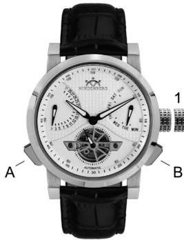
Convertor Modelnr.: 390-H automatisch uurwerk Kaliber H-11.390 33 lagerstenen