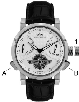
Convertor Modell-Nr.: 390-H Automatikwerk Kaliber H-11.390 33 Steine